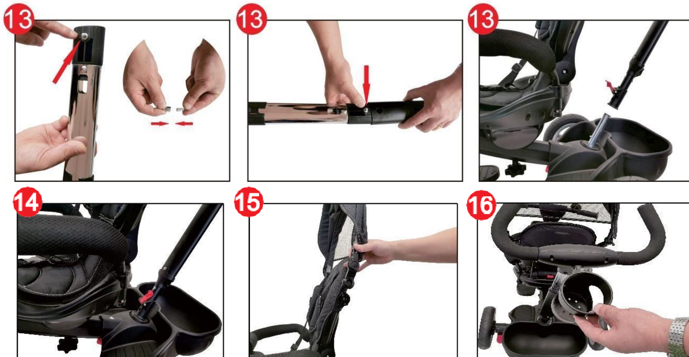
Fig.13 Tilslut den øverste skubbestang med den nederste trykstang i henhold til den viste funktion.

Fig.14 Sæt den samlede komplette stang ind i styrestangen . Fastgør ved at låse den røde knap.