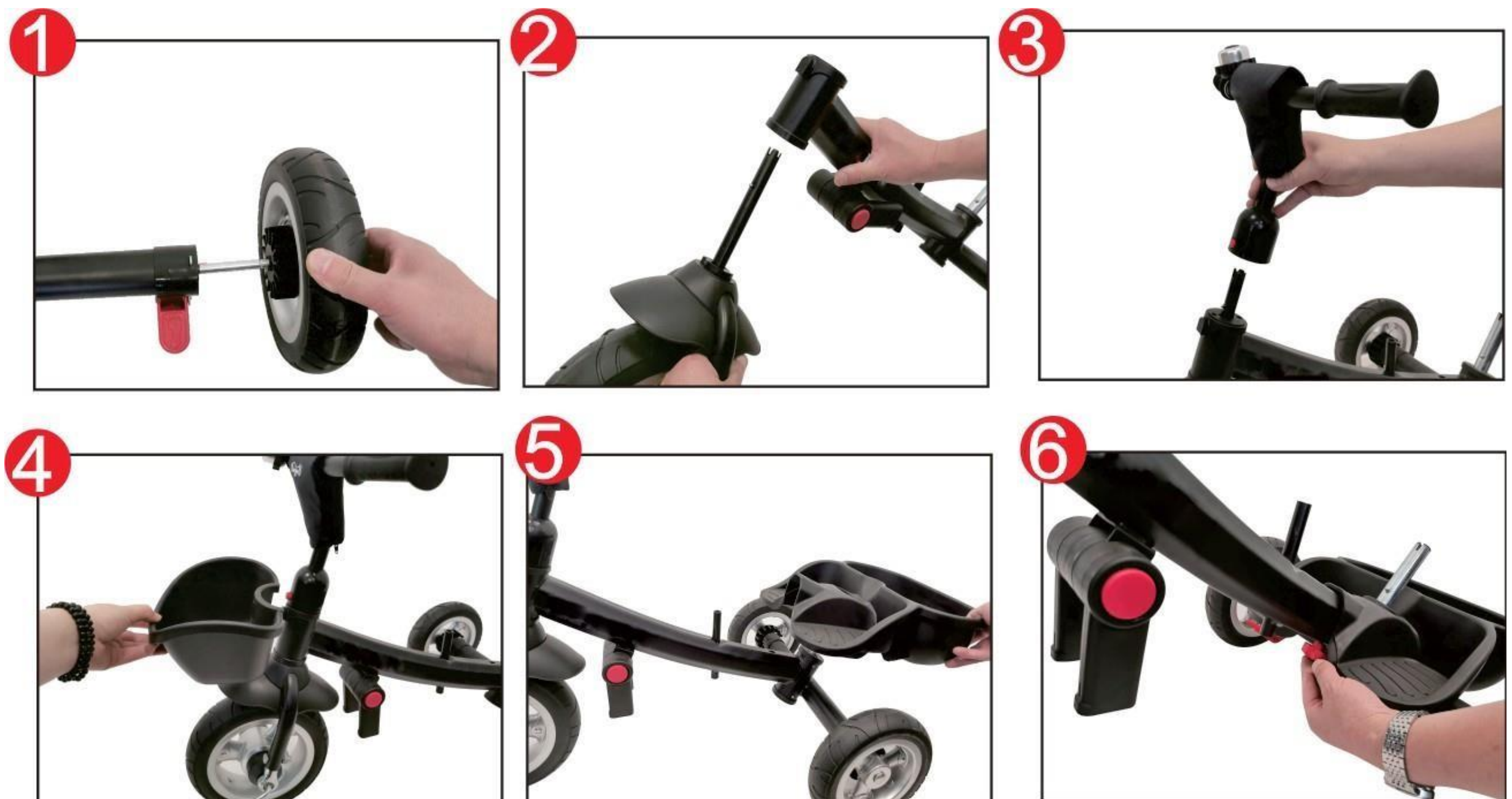
Fig.1 Saml baghjulene (6) på hver side af bagrammens aksel (2).

Hvis du kan høre et "klik", betyder det, at de er blevet rettet korrekt. Sørg for, at hjulene er fastgjort korrekt – test din installation ved at trække i hjulene et par gange, før du bruger dem.