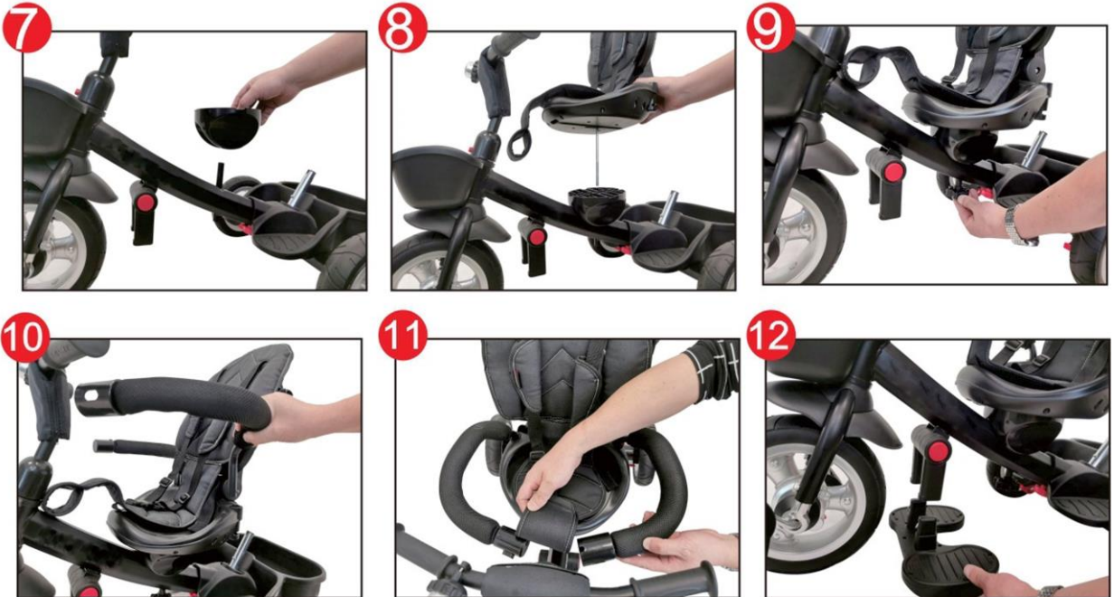
Fig.7 Placez la base du siège (10) sur le cadre, puis desserrez la vis de fixation de l'unité de siège (3).

Fig.8-9 Assembler l'unité de siège à travers la base (10), puis serrer la vis de fixation du siège.