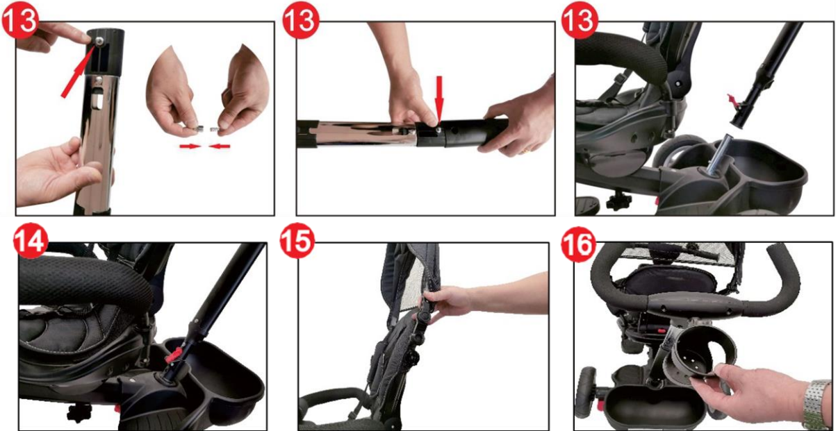
Fig.13 Reliez la tige de poussée supérieure à la tige de poussée inférieure selon l'opération indiquée.

Fig.14 Insérez la tige complète assemblée dans la barre de direction. Fixez-la en verrouillant le bouton rouge.