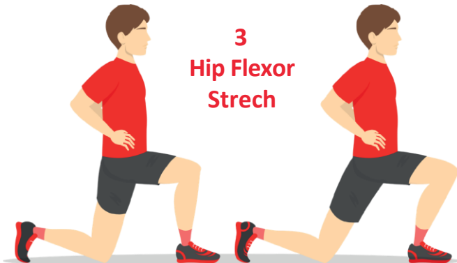
3 Hip Flexor Stretch