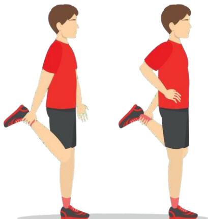
9 Quadriceps Strech