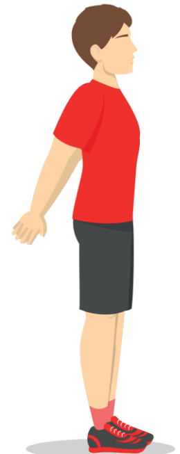
5 Chest Strech