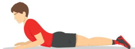
10 Cobra Pose