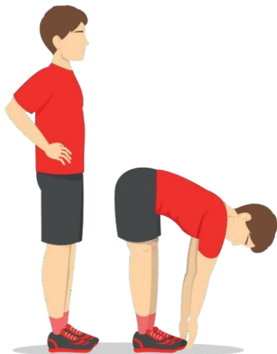
6 Forward Bend