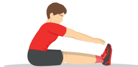
7 - Toe Touch