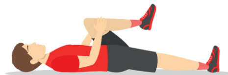
11 Thigh Hug