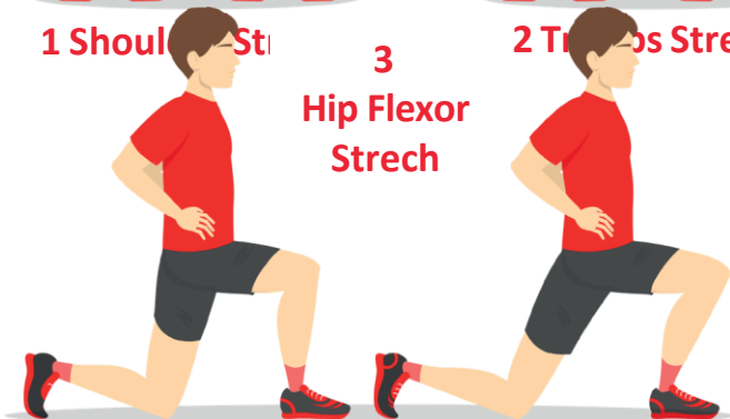
3 Hip Flexor Stretch