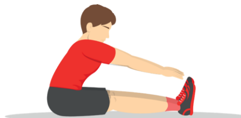
7 - Toe Touch