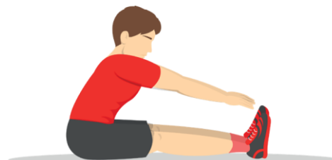
7 - Toe Touch