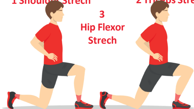
3 Hip Flexor Stretch