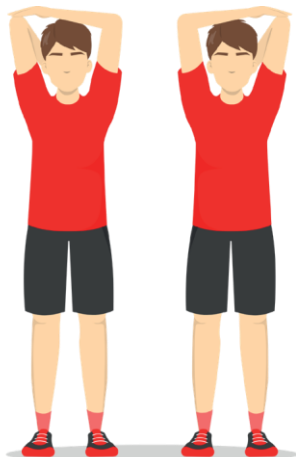
2 Triceps Stretch