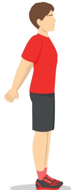
5 Chest Stretch