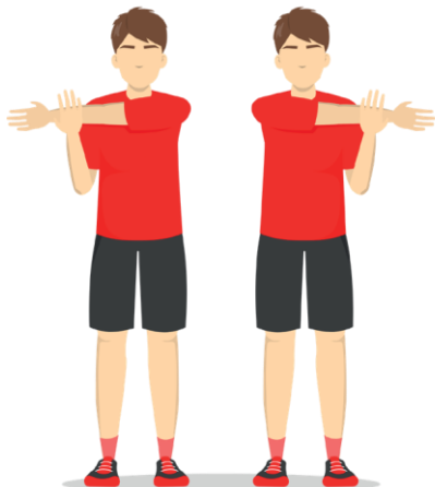
1 Shoulder Stretch