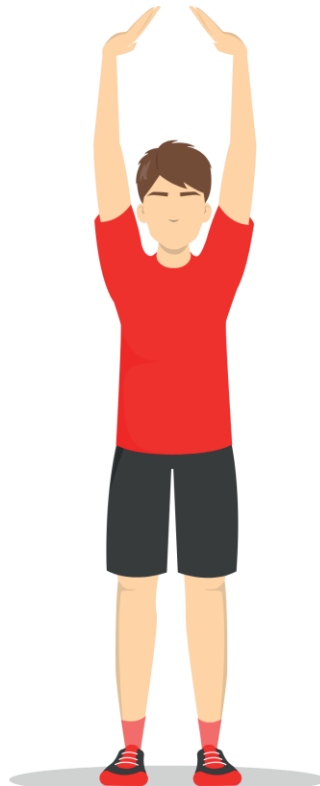
4 Overhead Stretch