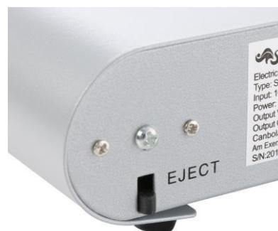
Fig 2 Uitwerpknop voor het handstuk