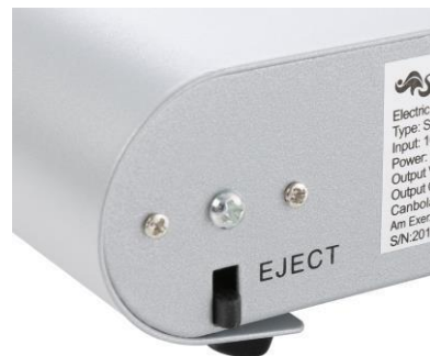
Bild 2 Utmatningsknapp för handstycket