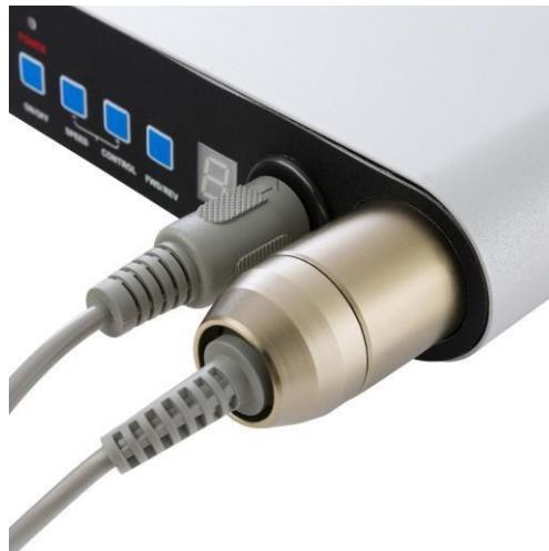
Bild 3 Handstycke