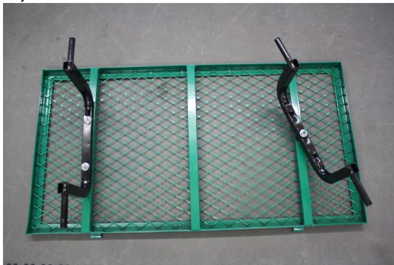
Ilustrace 2: levá osa hvězdy; pravá řízená náprava