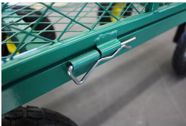
Ilustrace 5: Montáž boční stěny