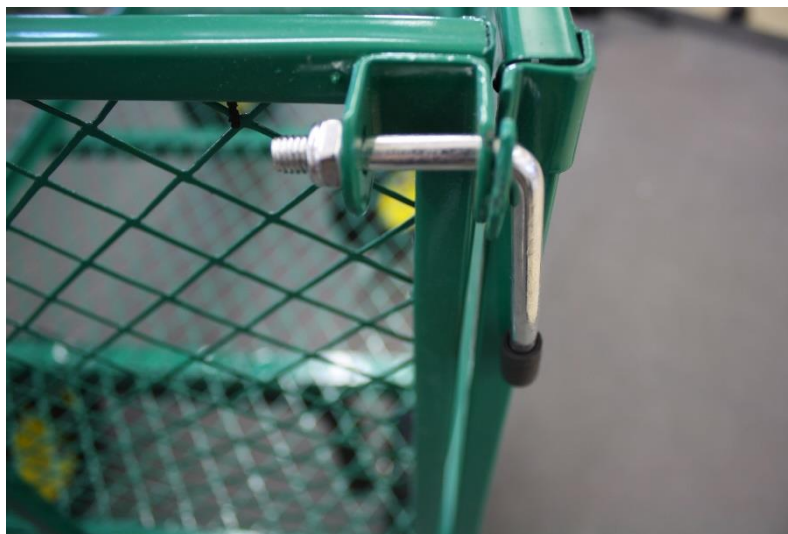
Ilustrace 6: Sestava "L-šroub"