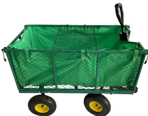
Ilustrace 7: Zahradní vozík s plachtou a policí