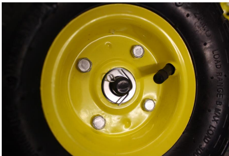
Illustration 3: Montering av hjulen