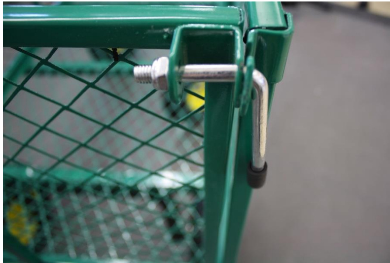
Illustration 6: Montering "L-skruv"