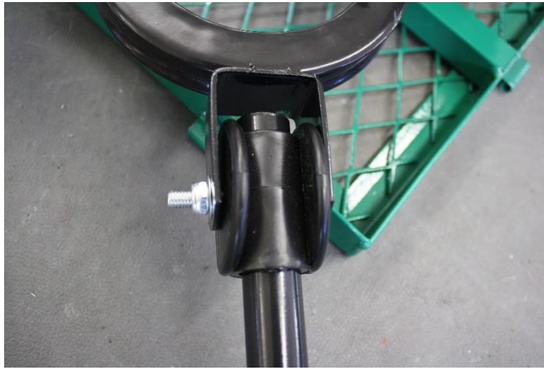
Illustration 4: Montering av handtaget