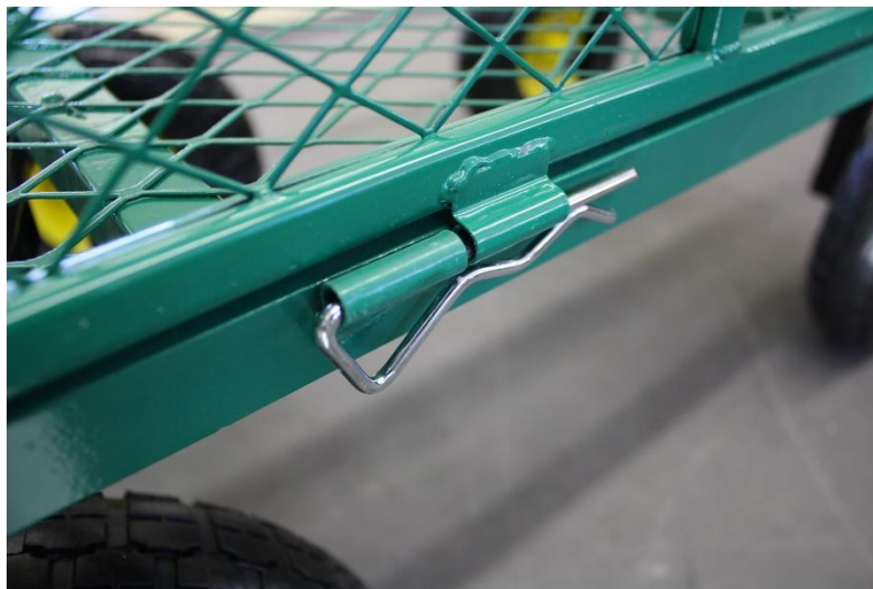
Illustration 5: Sidoväggsmontering