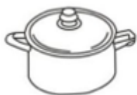
Gryde i rustfrit stål