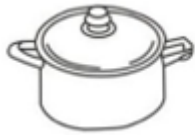
Hrnec z nehrdzavejúcej ocele