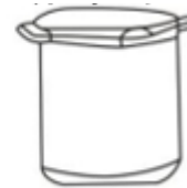
veľký hrniec na polievku